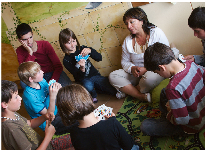
Dans les locaux de « La Courte Echelle », tout est mis en œuvre pour un accueil convivial des enfants.