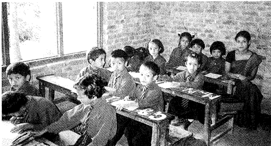
Une classe népalaise. Les enfants portent un costume identique pour gommer les différences sociales.

Je n'avais pas envie de gaspiller mon temps sur des plages et ne rien découvrir. Au travers des reportages, le Tibet dévoile des gens très accueillants; cette région m'attirait. Malheureusement, avec l'invasion chinoise, c'est très difficile d'y aller. Je pense que j'aurais découvert une