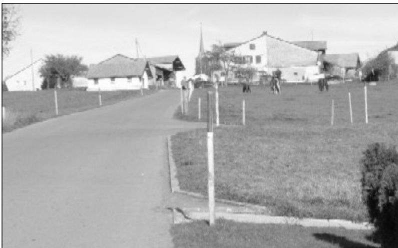
Le trottoir s'étendra sur environ 300m sur la droite de la chaussée

Les travaux d'aménagement, menés par la Commune de Sâles avec l'aide de la Corporation de triage de La Sionge, démarrent à la fin de l'hiver, l'inauguration étant agendée vers la fin juin 2005. Précisons que la Fondation Vita offrira les panneaux et la signalisation.