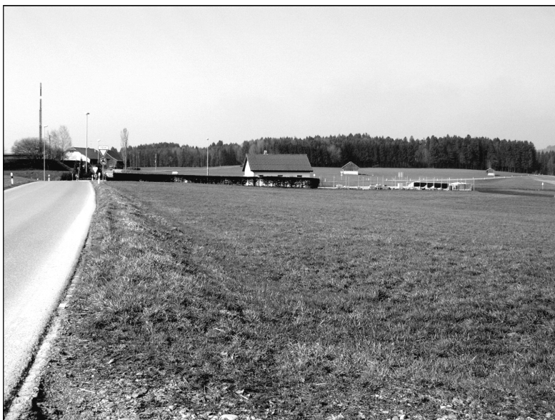
Zone de La Joretta, avril 2004