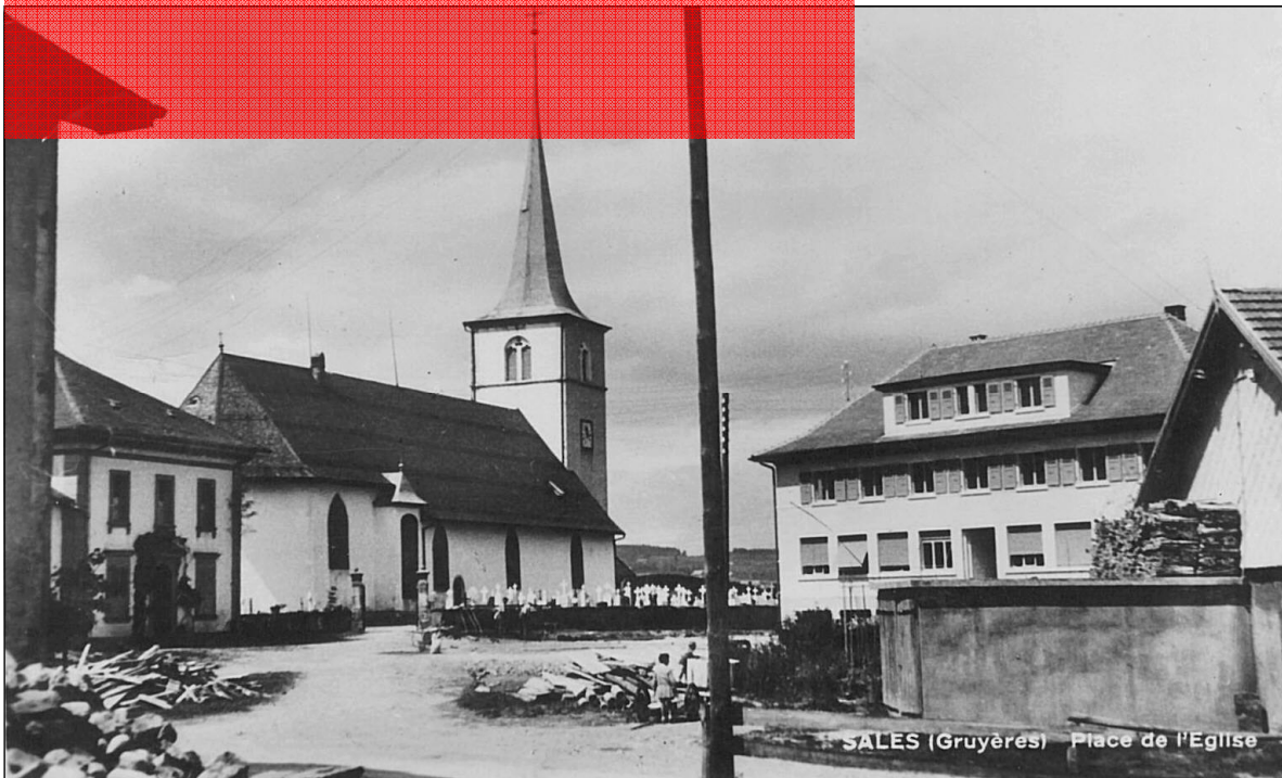
Eglise et place de l'école de Sâles