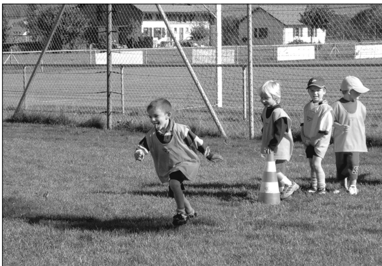
L'école de football du FC La Sionge

Nous rencontrons quelques difficultés. Beaucoup sont des footballeurs et leur enfant joue. Plus on monte dans les catégories, plus il est difficile de trouver des entraîneurs. Beaucoup cumulent les entraînements. Deux soirs par semaine, ils s'occupent de leurs juniors, avant de suivre la séance avec la 1 re équipe. C'est