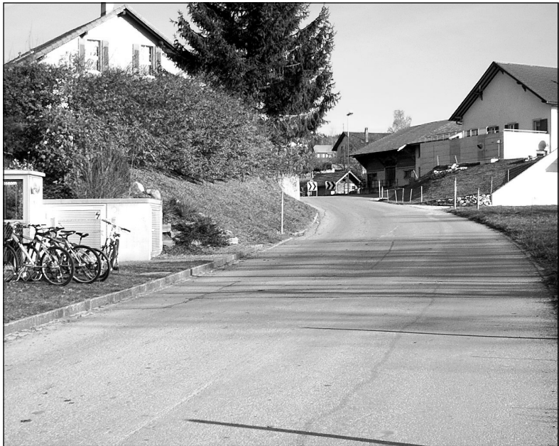
Route en direction de la laiterie de Romanens

Aussi, le Conseil communal a-t-il opté pour une réfection de ce collecteur. A des fins d'économie, elle