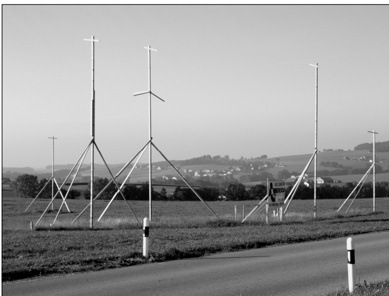
Zone de La Joretta avec les gabarits, septembre 2004